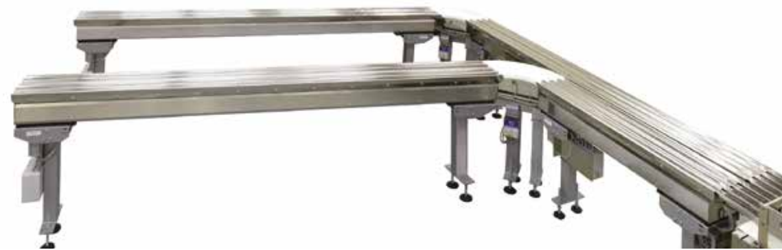
Canali vibranti per il trasporto del prodotto dall'area di carico alla farcitrice