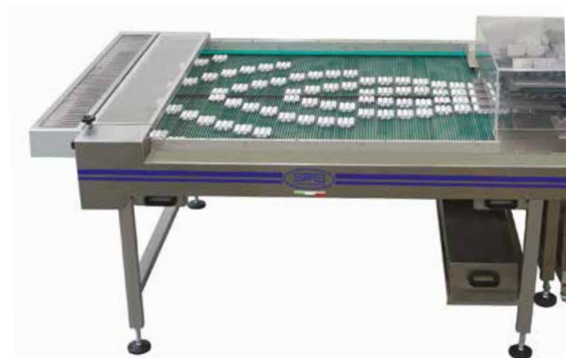
MOLTIPLICATORE DI FILE Sistema di moltiplicazione fino a 20 file